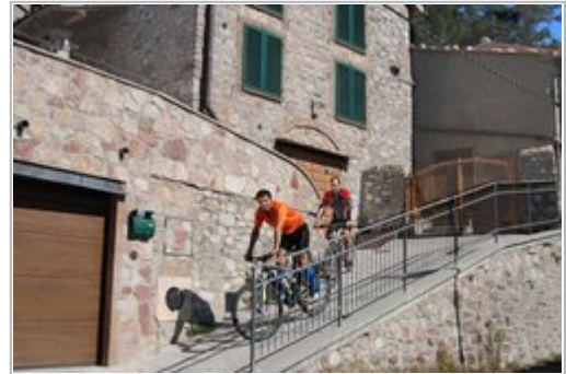
Mountainbike Tour Maremma Toskana

Das Bikehotel Prategiano ist der ideale Ausgangspunkt um diese anspruchsvollen Trails mit dem Mountainbike zu erkunden.